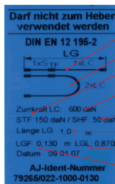
Label (blaues Etikett)

Zur Berechnung der Gurtanzahl benötigen Sie neben Angaben zur Ladung auch einige Daten zum verwendeten Gurt. Diese Angaben finden Sie immer auf dem Label.